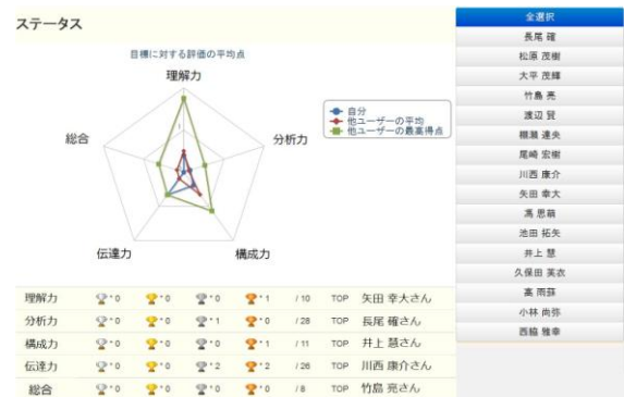
図2: 目標達成数を一覧するページ

ユーザーが自身の目標の達成状況などを容易に確認し、次の目標を設定するための、Webブラウザから閲覧可能な個人用のページ(マイページ)を作成した。マイページでは、自他のカテゴリ毎の目標達成数を一覧できるようなページ(図2)や、議論スキルグラフを閲覧しながら次の目標を設定できるようなページ(図3)を用意した。