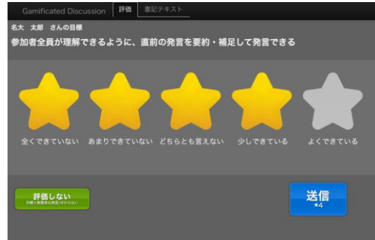
図4: 発言評価インタフェース

議論スキルは、発言の内容に関するスキルがほとんどであり、これらを機械的に評価することが困難であるため、人間による評価が可能な発言評価インタフェースを Web ブラウザアプリとして作成した。図4のように発言者の目標を五段階で評価することをルールとした。