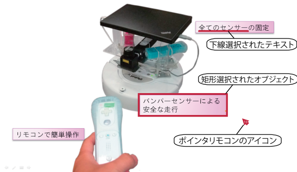
図 1: オブジェクトへの指示

を用いることで、矩形選択では指示できないスクリーン上の任意のテキストに対しての指示が可能になる。またこれらの指示を行う際、指示者の操作ミスを軽減するために、指示の確定を一時的に保留状態にする機能がある。そして指示の確定した指示対象は指示者が常に分かるよう、図 1 のように各ポインタリモコンが持つ固有の色のついた枠線や下線が表示される。また指示の状態はオブジェクトを指示している人が指示の状態を解除するまで続く。このようにして様々な指示を可能にすると同時に、指示者名や指示の開始・終了時間、オブジェクトの Id やバウンディングボックス、そしてオブジェクトに関連しているテキスト情報や画像といったメタデータも取得している。